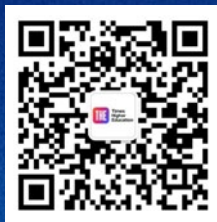
泰晤士高等教育 微信公众号

如果您想要了解您的大学如何参与中国学科评级或有任何疑问，请联系我们的团队，或关注泰晤士高等教育的微信公众号了解我们的最新动态。