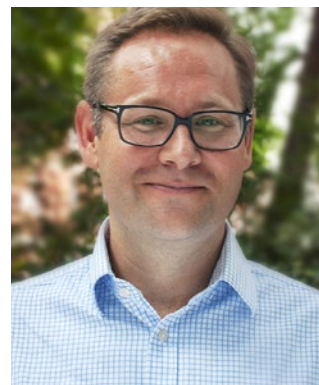
菲尔·巴蒂 (Phil Baty) 泰晤士高等教育首席全球事务官

虽然中国学科评级在制定之初聚焦中国高校, 但它所描绘的全球大学图景的绩效基准赋予了该排名全球视角。因此, 泰晤士高等教育中国学科评级不仅是面向中国学生、高校和政策制定者的资源, 也是可供全球其他地区教育社区参考的资源。